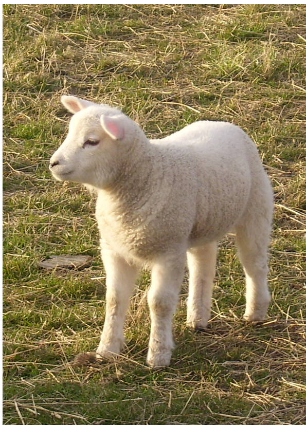
Et af de søde små lam på Thorø. April 2009.